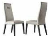
2 CHAIRS KJNV620 2 CHAIRS (UK FIRE RETARDANT) KJNV620I

*NOTE: A RECESSED DECORATIVE ELECTRIC FIREPLACE MEASURING 26" CAN BE INSERTED IN THE FIREPLACE BASE UNIT