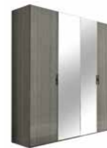
4/D SWINGING WARDROBE (wooden doors) PJNV0013 (with 2 central mirrors) PJNV0014

Inner size inch 73 1/2" x 85 3/4" - cm 187 x 218 inch W 81" D 92" H 50" cm L 205 P 233,6 H 127,6 Crts 2 kg 118 m 3 0,34