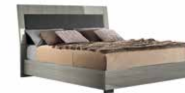
Q.S./UK 5" BED PJNV0150 (UK FIRE RETARDANT) PJNV0150I

inch W 57" D 24" H 30" cm L 144,1 P 61,2 H 77 Crts 1 kg 43 m 3 0,28