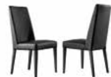
2 PABLO CHAIRS KJNV621 2 PABLO CHAIRS (UK FIRE RETARDANT) KJNV621I

inch W 20" D 24" H 42" cm L 51 P 60 H 105,5 Crts 1 kg 18 m 3 0,42