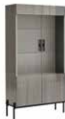
2/D CURIO CABINET PJDNV0600 With 2 glass doors and 2 wood doors

inch W 63"/83" D 37" H 30" cm L 160/210 P 95 H 76,3 Crts 2 kg 100 m 3 0,59