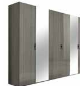
6/D SWINGING WARDROBE (wooden doors) PJNV0017 (with 2 mirrors) PJNV0018

With 6 doors, 3 shelves and 6 hanging rods inch W 116" D 24" H 90" cm L 295 P 61,2 H 227,5 Crts 10 kg 319/341* m 3 0,95/0,95*