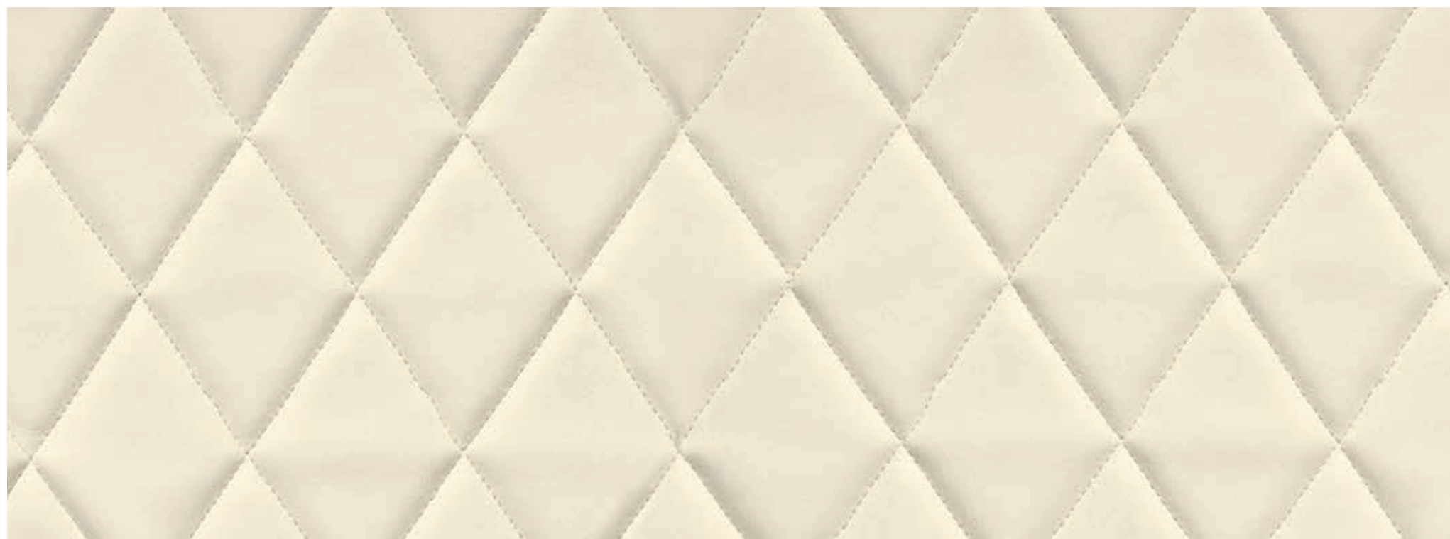
— Ecopelle avorio trapuntata a rombi / Quilted ivory ecoleather / Экокожа Авorio Rombi