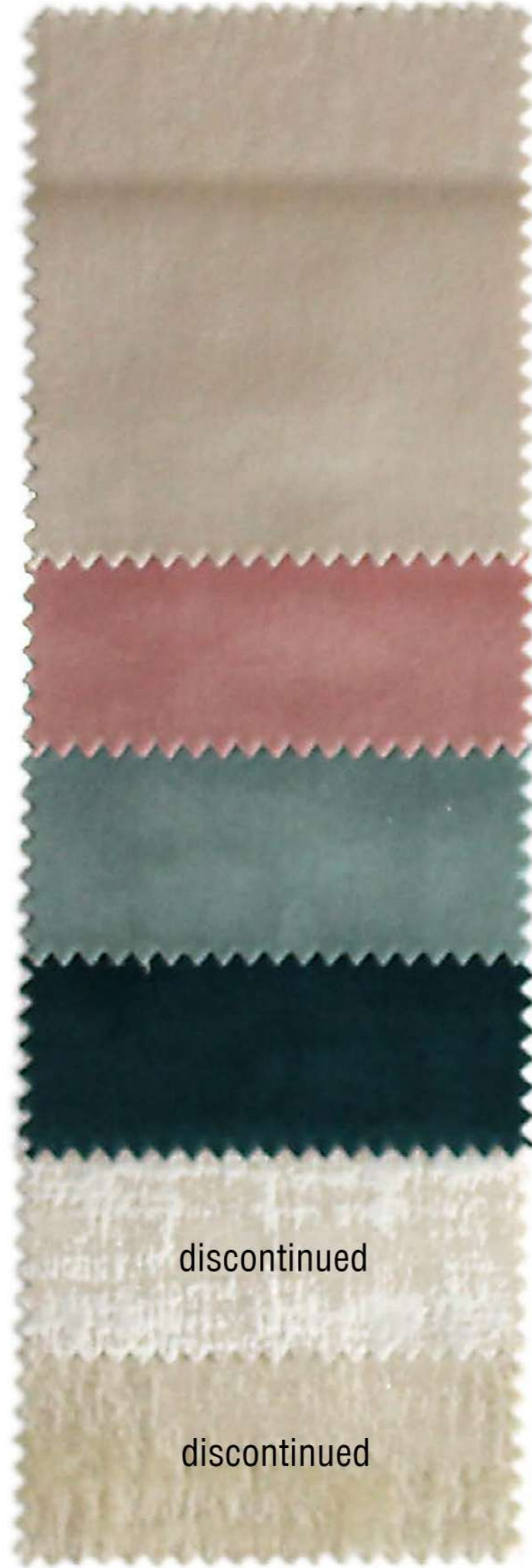
Tela N° 123 Serie A