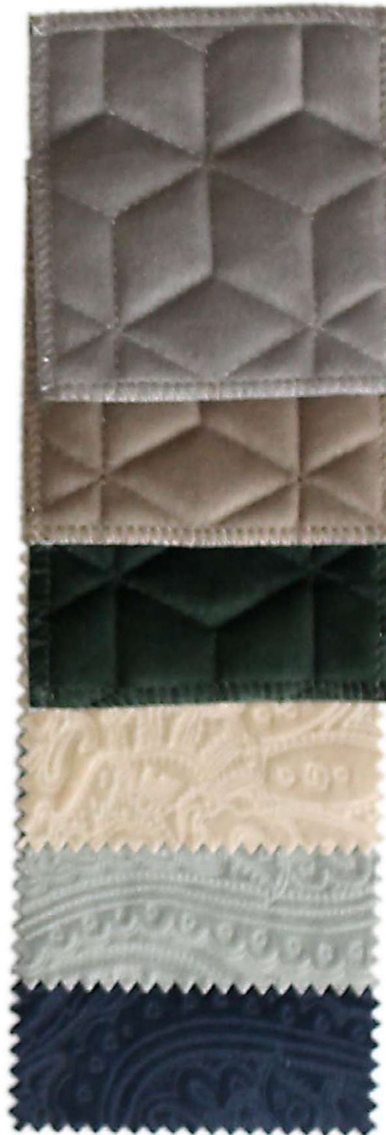
Tela N° 129 Serie B