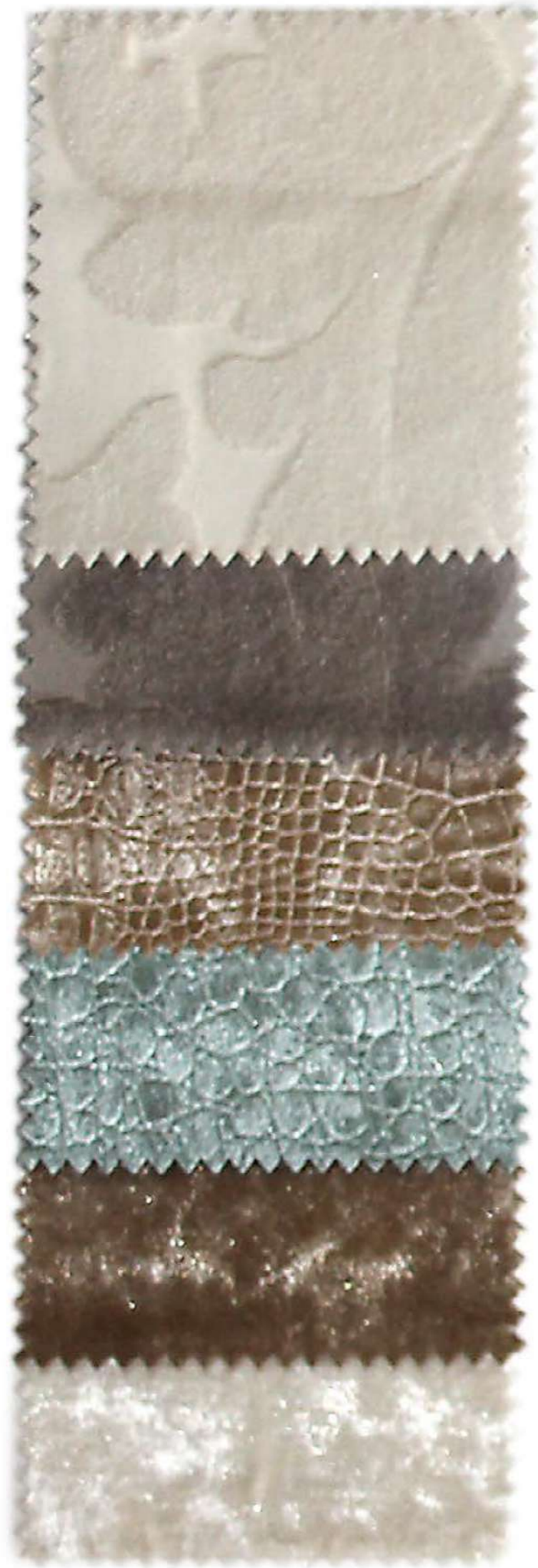
Tela N° 102 Serie A