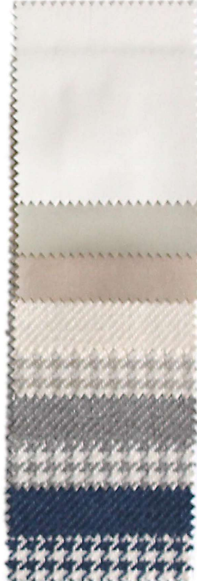
Polipiel N° 61 Serie A