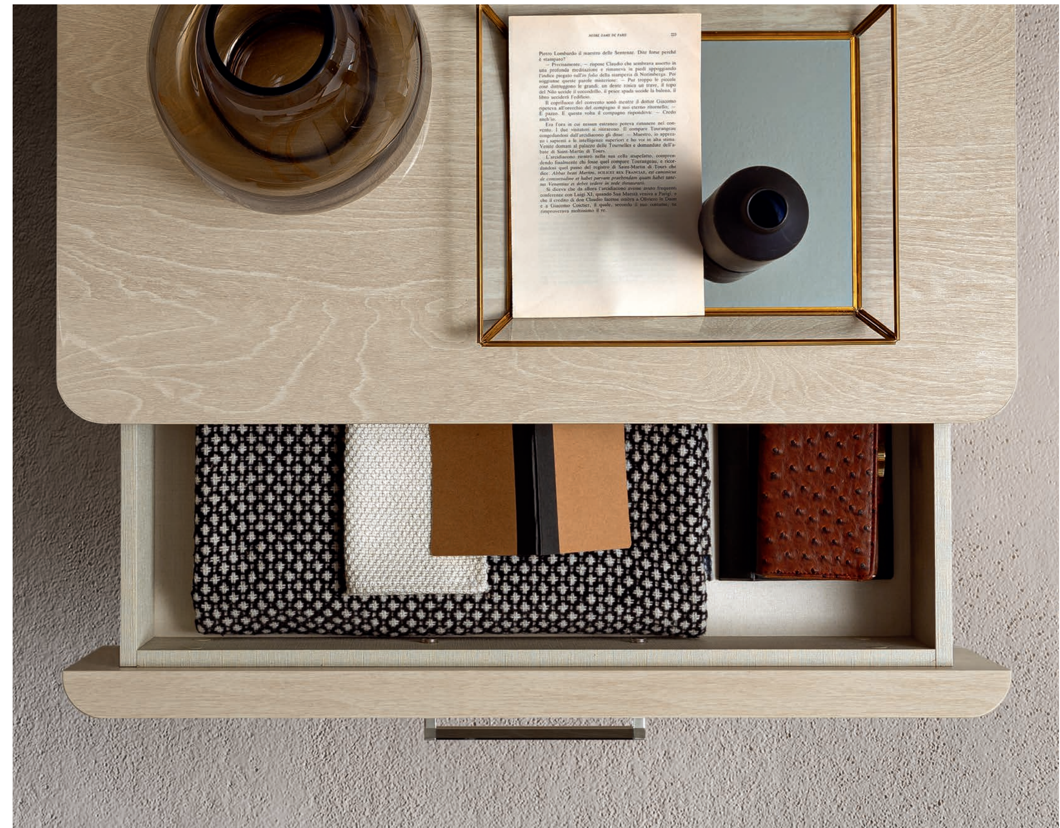
Comodino Maxi con maniglia Milano e piedini Flat.