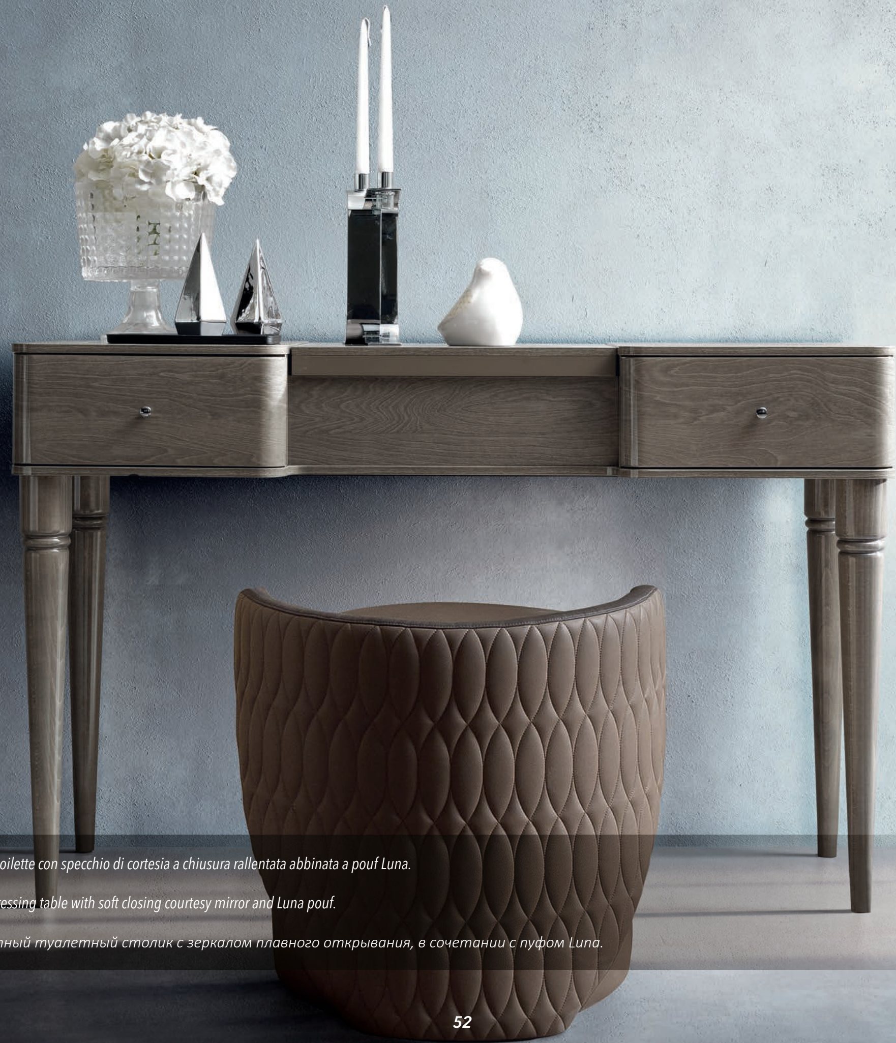
Elegante toilette con specchio di cortesia a chiusura rallentata abbinata a pouf Luna.