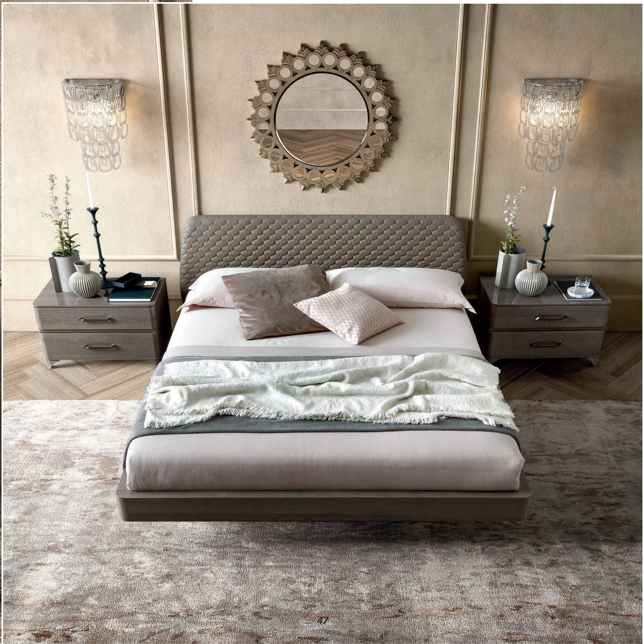
Кровать SMART с изголовьем Akademy, в обивке из бархатной на ощупь эко-кожи с прострочкой в виде молекулярной решетки.