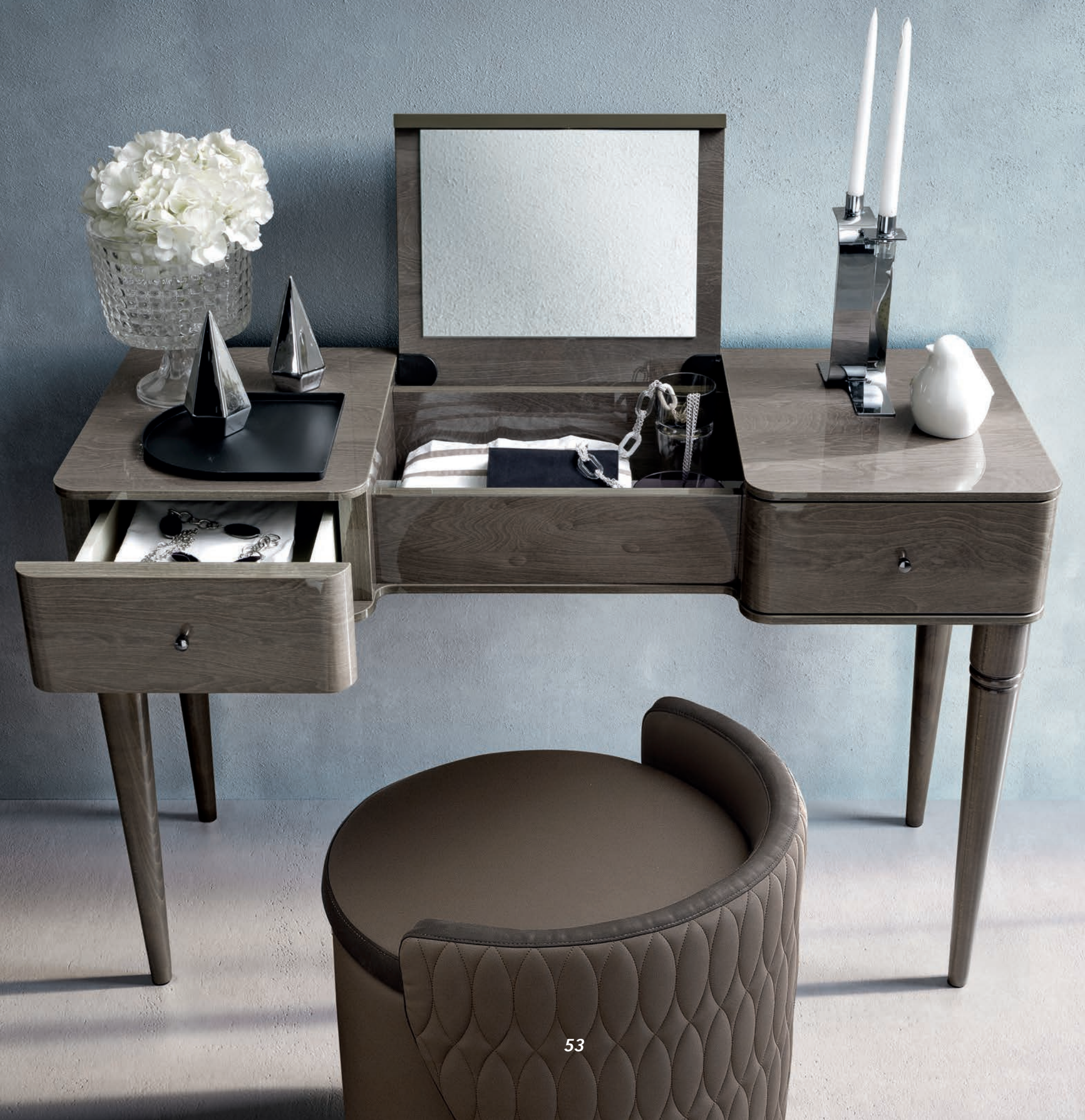
Элегантный туалетный столик с зеркалом плавного открывания, в сочетании с пуфом Luna.