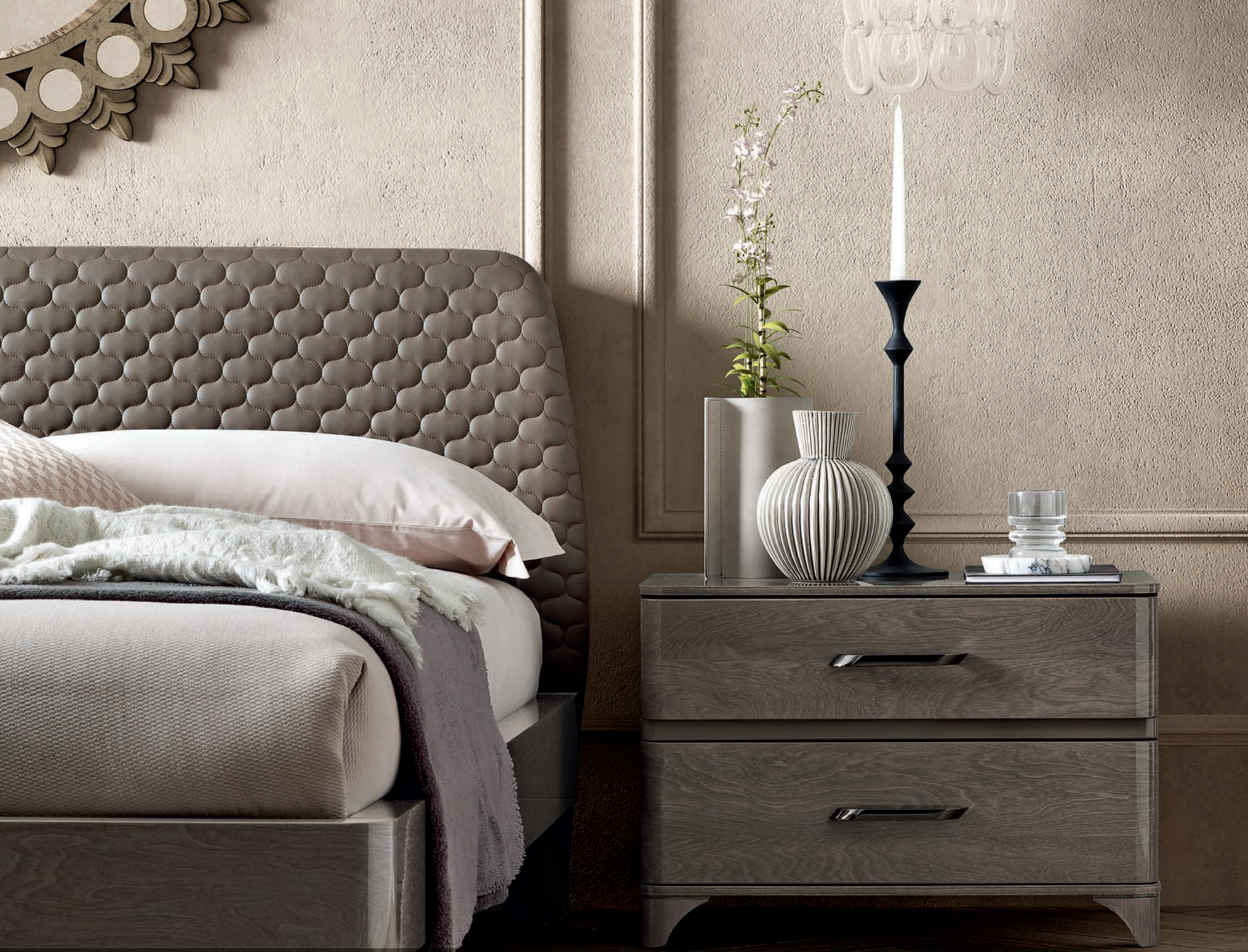
Letto SMART con testiera Akademy rivestita in ecopelle soft-touch trapuntata con disegno a struttura molecolare.