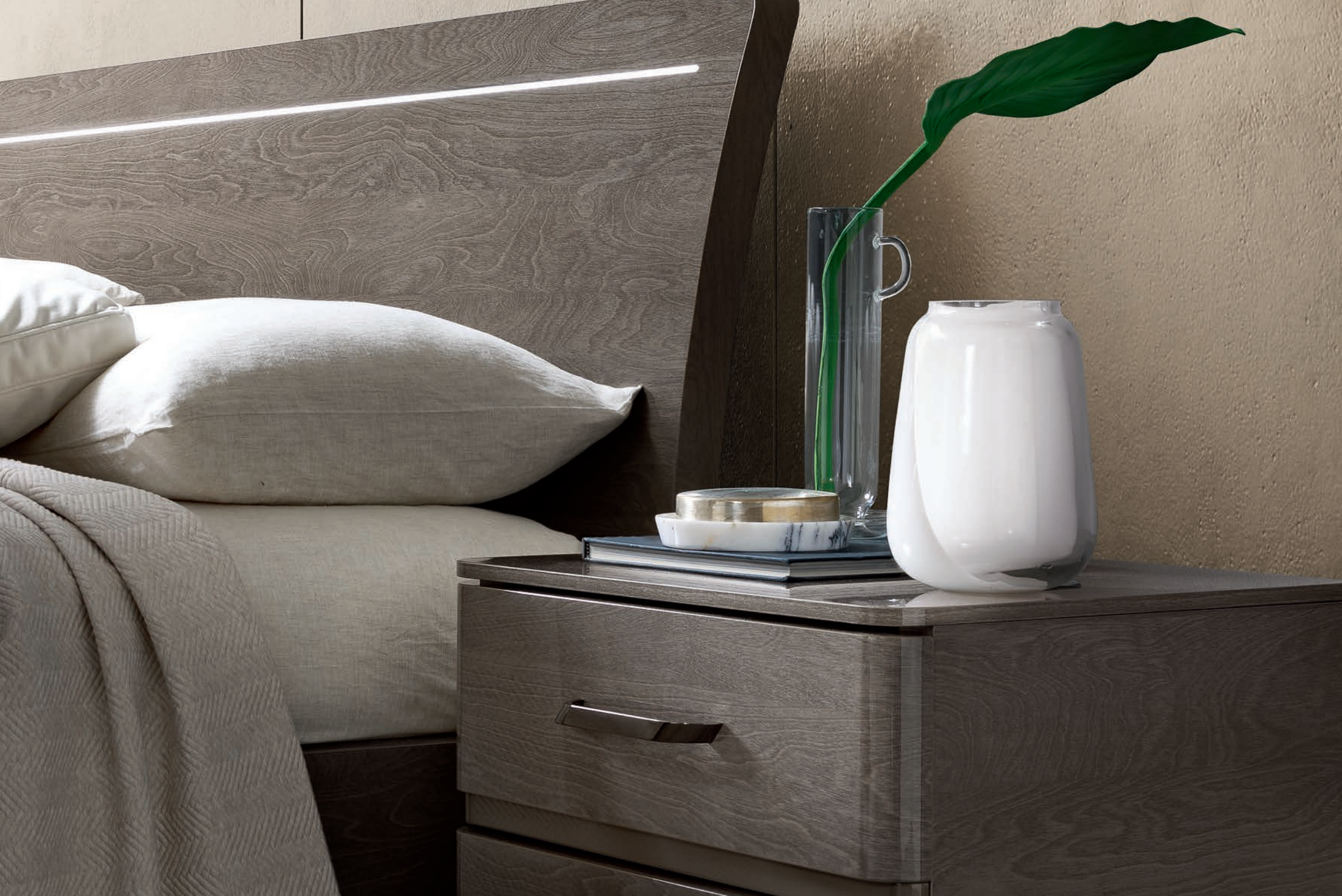
Letto LUX con testiera curva a spigoli arrotondati e profilo a luce LED.